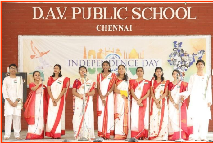
बंगाली देशभक्ति गीत प्रस्तुति