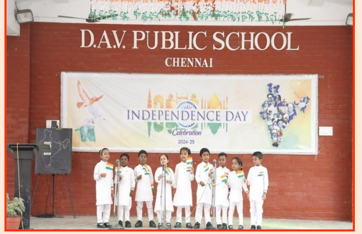
यू.के.जी. विद्यार्थियों द्वारा देशभक्ति गीत प्रस्तुति